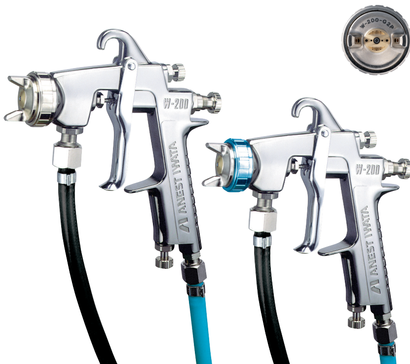
W-200 PICO ESTANDAR